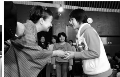
ひとりひとりにプレゼント